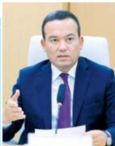
Улуғбек ҚОСИМОВ, Сурхондарё вилояти ҳоқими