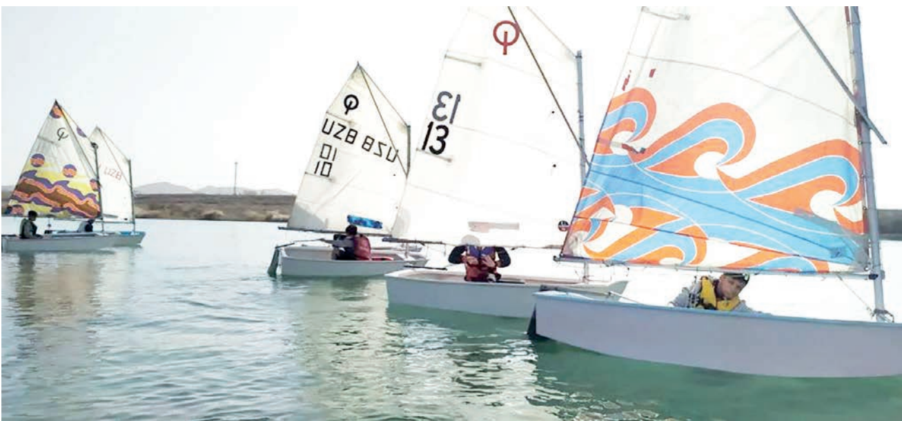
Навоийская область.