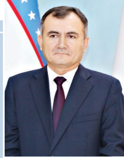
Муротжон АЗИМОВ, Қашқадарё вилояти ҳокими

Хусусан, давлатимиз раҳбари ташаббуси билан ҳар бир ҳудудда камбағалликни қисқартришга катта эътибор қаратилган. Аҳолининг кенг қатлами қамраб олинб, ишсизлик босқичма-босқич бар-тарараф этилмоқда. Ишлатилмай келинаётган томорқалардан унумли фойдаланиш умуммиллий ҳаракати бошланди. Ўзини ўзи банд қилиш, яқка ва оилавий тадбир-корлик ривожлантишти. Имтиёзли кредит ажратилиб, янги иш ўринлари очилмоқда. Бундан ташқари, деҳқончилик, чорвачилик, боғдорчилик йўналишларида ҳам кенг қўлайликлар яратилмоқда.