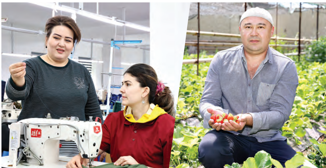
5 миллионов 200 тысяч человек и вывести из бедности 1,5 миллиона.

Согласно данным, в январе трудоустроены 277 тысяч граждан, из них 91 тысяча получила постоянную работу, а 153 тысячи вовлечены в предпринимательскую деятельность. Тот факт, что большинство стали предпринимателями, свидетельствует об успешном внедрении новой системы. Кроме того, в 2025 году планируется обеспечить занятость