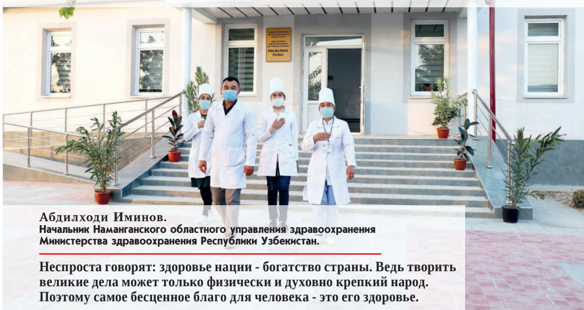
Абдилходи Иминов. Начальник Наманганского областного управления здравоохранения Министерства здравоохранения Республики Узбекистан.

Неспроста говорят: здоровье нации - богатство страны. Ведь творить великие дела может только физически и духовно крепкий народ. Поэтому самое бесценное благо для человека - это его здоровье.