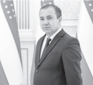
Утир Тиллаев. Начальник Управления дошкольного образования Навоийской области.