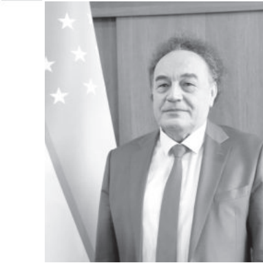
Саидасор Гулямов. Академик.