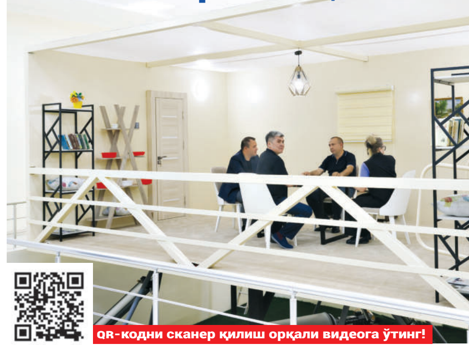
QR-кодни сканер қилиш орқали видеога ўтинг!

Халқаро тадқиқот институти сугориш зонасидаги ерининг шўрланиши критик