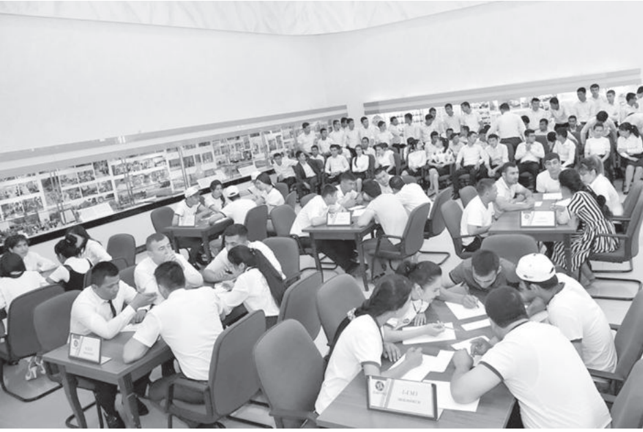
«Окончание. Начало на 1-й стр.»

Вуз создан 27 лет назад в целях обеспечения развития горно-металлургического комплекса и подготовки кадров высокой квалификации для отечественной добывающей и перерабатывающей промышленности.