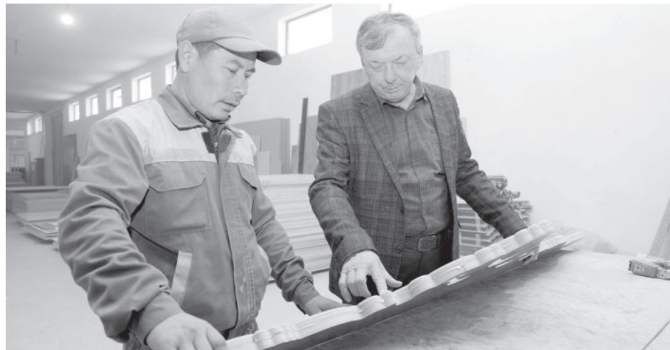
При содействии Центра устойчивого развития Республики Узбекистан.

востребованному ремеслу, наладил семейное дело. Поначалу было трудно. На сегодня уже созрел план по расширению бизнеса.