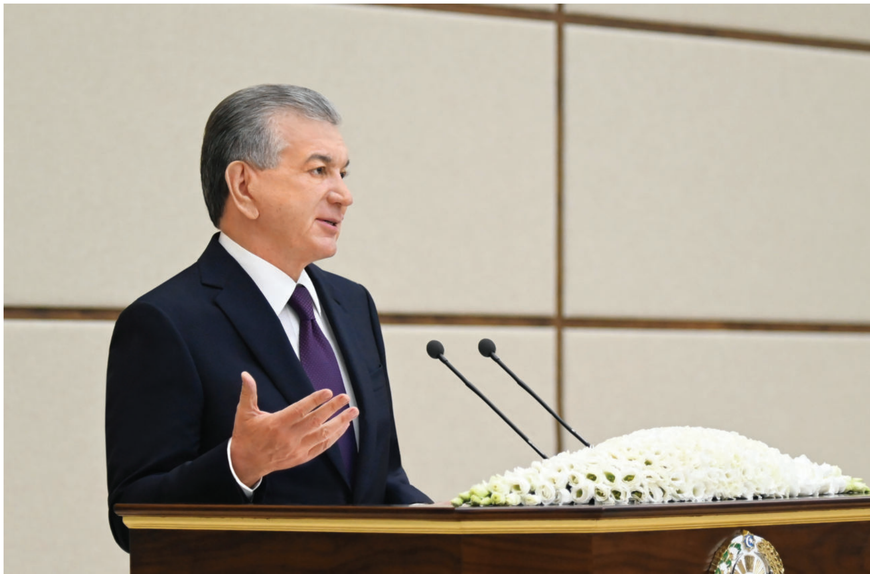
Президент Республики Узбекистан Шавкат Мирзиёев в целях ознакомления с ходом осуществляемых реформ на местах и жизнью населения 12-13 мая посетил Ферганскую область.

Во второй день поездки в городе Фергане с участием главы государства состоялось совещание по вопросам социально-экономического развития Ферганской области.