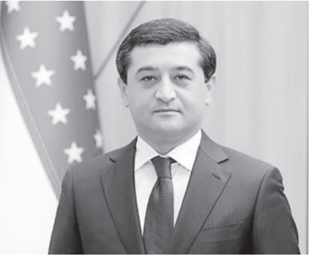
Бахтиёр Саидов. Министр народного образования Республики Узбекистан.