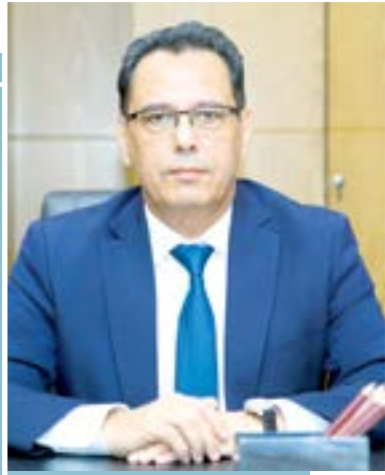
Кўнғиротбой ШАРИПОВ, олий таълим, фан ва инновациялар вазири

Олий маълумот ҳар бир инсонга жамиятга ўз ўрни ва мавқега эга бўлиш имконини берса, давлатга билимиларни танлаб олиш, қўллаб-қувватлаш ҳамда ижтимоий, иқтисодий, муҳандислик ва технология соҳаларини илмий-институционал қамраб олишга, пировадига, инсон капиталини самарали йўналтиришга хизмат қилади.