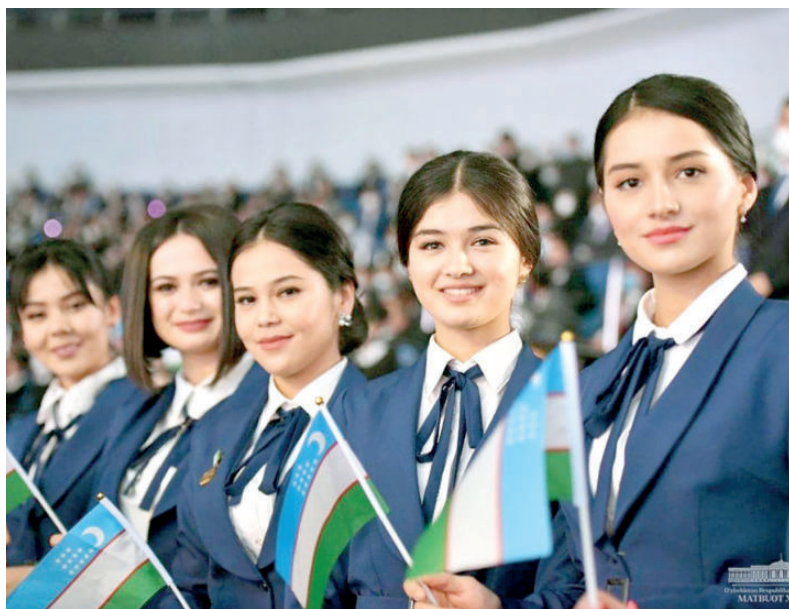
Именно молодежи принадлежит ведущая роль в реализации реформ в политических, экономических и социальных

Основополагающие реформы, произошедшие в жизни нашей республики за 30 лет независимости, прежде всего оказали огромное влияние на молодежь, ее жизненные позиции, ценностные ориентиры и социальные ожидания. Успех дальнейшего реформирования и модернизации страны зависит и от многомиллионного растущего поколения, в руках которого будущее государства.