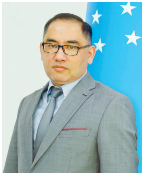
Шохрух Шарахметов. Председатель Антимонопольного комитета Республики Узбекистан.