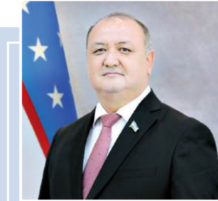
Abdushukur HAMZAYEV, Oliy Majlis Qonunchilik palatasi fraksiyasi rahbari