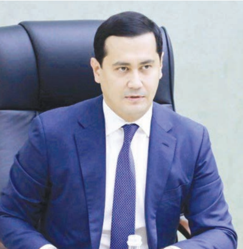
Сардор УМУРЗОКОВ, заместитель Премьер-министра Республики Узбекистан, министр инвестиций и внешней торговли:

Члены правительства, руководители министерств и ряда ведущих промышленных предприятий высказали свое мнение о работе, проводимой по направлениям, о достигнутых результатах исходя из задач, поставленных Президентом страны.