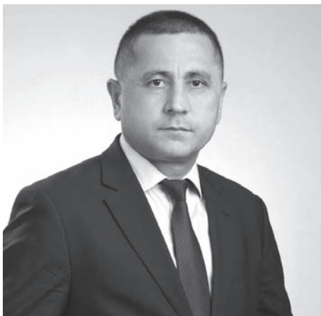
Мехриддин АБДУЛЛАЕВ, председатель правления АО «Узбекнефтегаз»:

Наша главная цель - выполняя все запланированные работы в установленные сроки, вносить свою лепту, способствовать развитию экономики страны.