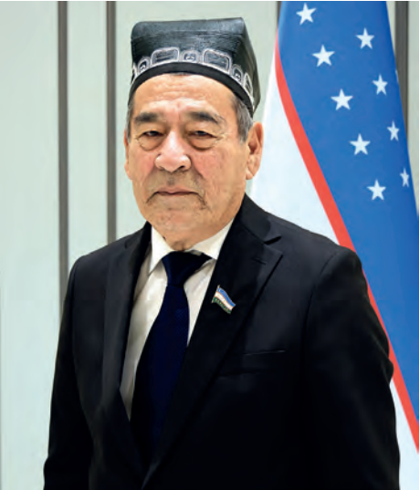
Уктамжон Ахунув. Член Комитета Сената Олий Мажлиса Республики Узбекистан по бюджету и экономическим вопросам.