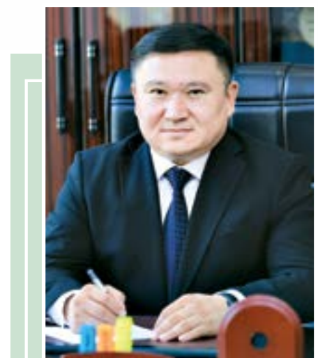
Муҳиддин ПЎЛАТОВ, иқтисодиёт фанлари доктори, профессор

Оилада фарзандни тежамкорликка, тadbиркорликка, ташаббускорликка ўргатиш, дунёвий илмлар ва ҳаёт илмидан воқиф этиш, касб-хунар сирларини кунт билан эгаллаш учун шарт-шароит яратиш ҳаёт сўмоқларида адашиб қолмаслик ва раvon йўлдан боришда ёрдам беради.