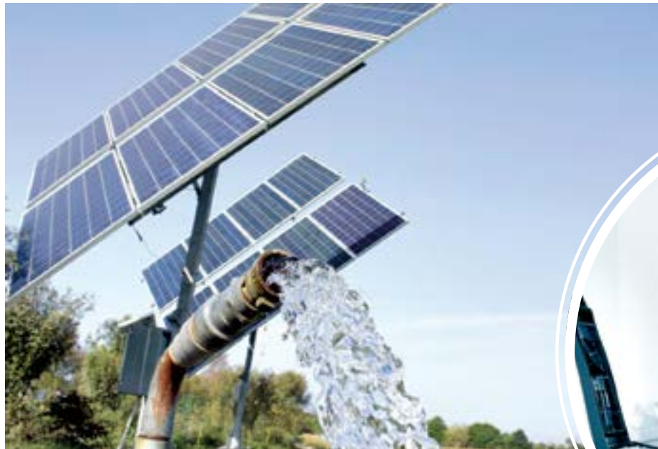
Сув текин эмас!

Бугунги глобал вазият одамларда ичимлик сувга муносабатини ўзгартириш, ундан оқилона фойдаланишга қаратилган жиддий чоралар кўрилиши ҳам талаб этамоқда. Афсуски, кўплаб шаҳарларда аҳолининг сувни тежаш муаммосига пассив муносабати мавжуд. Кўп ҳолларда сувдан фойдаланишда ҳамон исрофгарчиликка йўл қўйилмоқда. Баъзилар машинасини тоза ичимлик сувда юваётгани, бошқалари салқинлик яратиш мақсадида офтобда иссиқ асфальтнинг ичимлик сув билан “суғориши” жуда ачинарли. Тўғри, бу одатлар азалдан синган, ариқларни тўлдириб оқиб турган сув бунга имкон берган, ичимлик сув муаммоси ҳали глобал миқёсда гапирилмаган вақтларда тежамкорликка эътибор қаратилмаган бўлиши мумкин. Бироқ бугун вазият ундай эмас. Жаҳонда жиддий қургочлик, сув тақчиллиги бошланган. Сув манбалари тобора қисқариб борапти. Бунга сабаблар кўп, албатта. Улар орасида, афсуски, инсоният ушбу бебаҳо неъматдан ҳўжасизларча фойдаланётгани ҳам йўқ эмас.