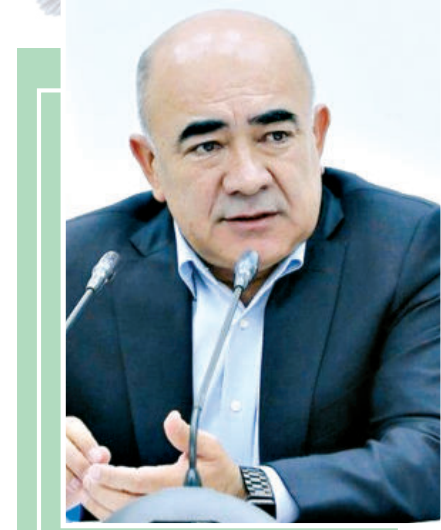
Зойир МИРЗАЕВ, Тошкент вилояти ҳоқими

қилиб борилади. Ўтган йил вилоят миқёсида ўтказилган 80 дан ортиқ муҳокамада тизимнинг афзаллиги яққол сезилди, меҳнат унумдорлиги салмоқли даражада ошди. Йил давомида ижро жараёнида сусткашликка йўл қўйган 43 мутасаддига интизомий жазо қўлланилди.