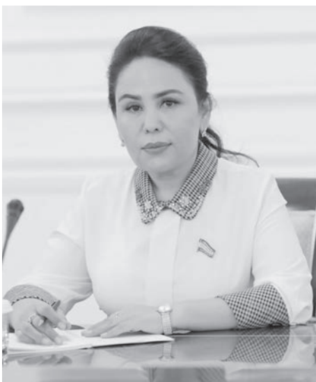
Одинахон Отахонова. Депутат Законодательной палаты Олий Мажлиса Республики Узбекистан.