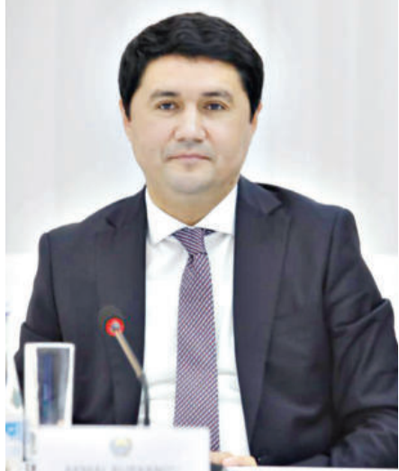
Акmal БУРХОНОВ, Коррупцияга қарши курашиш агентлиги директори