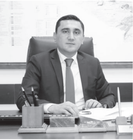
Аъзам Кадирходжаев. Заместитель председателя Государственного комитета Республики Узбекистан по геологии и минеральным ресурсам.