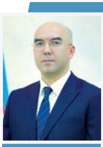
Бахтёр ПЎЛАТОВ, Марказий Осиё атроф-муҳит ва иқлим ўзгаришини ўрганиш университети ректори, техника фанлари доктори, профессор

Жорий йил 17 март куни Президентимиз Ўзбекистондаги Ислон цивилизацияси марказининг расмий очилиши ҳамда ифторлик маросимида иштирок этди. Тадбир аввалида давлатимиз раҳбари бутун халқимизни муборак Рамазон ойи билан яна бир бор қутлади. Ҳозирги гоат таҳликали замонада тинчлик нақадар улуг ва бебаҳо неъмат эканини, 38 миллиондан зиёд аҳолимиз ягона халқ, аҳил бир оила бўлиб яшаётгани энг катта бойлигимиз эканини чуқур ҳис этиш зарурлигини таъкидлади.