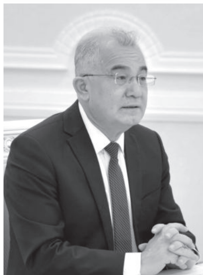
Акмал Саидов. Первый заместитель Спикера Законодательной палаты Олий Мажлиса, директор Национального центра Республики Узбекистан по правам человека.