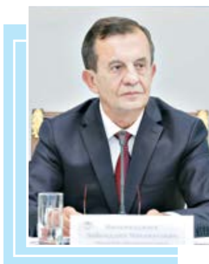
Зайниддин НИЗОМХЎЖАЕВ, Ўзбекистон Республикаси Марказий сайлов комиссияси раиси, Ўзбекистон Қаҳрамони