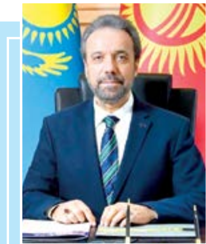
Меҳмет Сурейя ЭР, Туркий Парламент Ассамблеяси бош котиби

Иқтисодий ривожланиш, маданий юксалиш ва аҳолини ижтимоий қўллаб-қувватлашга устувор аҳамият бериб, Ўзбекистон нафақат ўз халқининг турмуш даражасини оширишга, балки жаҳон саноатида фаол иштирокчи сифатида ўзини намойиш қилишга интиломоқда. Мазкур жараёнда, жумладан, миллий маданий ва маънавий меросни асраб-авайлаш ҳамда кўпайтириш, санъат ва бадий ижодни ҳар томонлама ривожлантириш, халқни миллий ва жаҳон маданиятининг энг яхши намуналаридан баҳраманд этиш, маданият муассасалари фаолиятини такомиллаштириш, малакали кадрлар тайёрлаш, давлатлараро ва халқаро маданий алоқаларни кенгайтириш ҳамда мустақамлаш, бебаҳо маданий меросни халқро миқёсда кенг тарғиб қилиш борасидаги сазой-ҳаракатлар алоҳида эътирофга лойиқ.