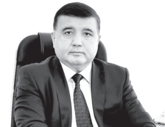
Баходир Бегалов. Председатель Государственного комитета Республики Узбекистан по статистике, доктор экономических наук.

В настоящее время в Узбекистане мало вопросов, дающих социально-экономическую информацию о населении. Наша республика участвовала в двух раундах мультииндикаторного кластерного обследования в 2000-м и 2006 годах. До недавнего времени пользовались сведениями 2006-го. Однако прошло 15 лет. Общество пережило коренные изменения, особенно за последние годы. Страна обновилась, помолодела и активно развивается. Само время требует предоставления достоверных и широкомаштабных источников для обновления данных и принятия соответствующих международных стандартам социально-экономических решений.