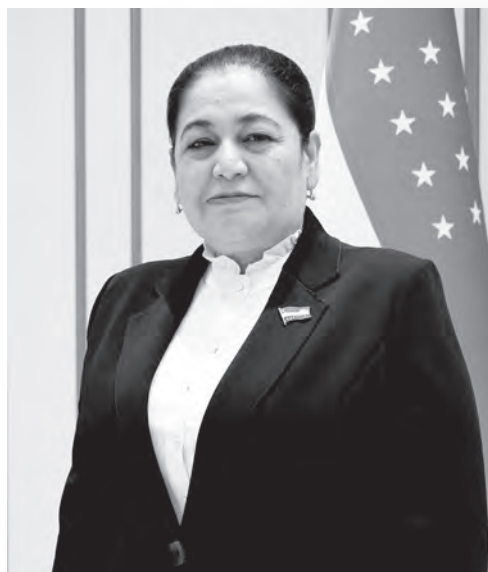
Дилбар Сувонова. Сенатор, член Комитета Сената Олий Мажлиса Республики Узбекистан по вопросам науки, образования и здравоохранения.