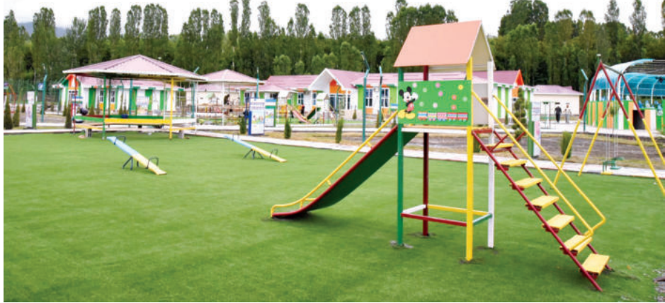
Шерафот Қорабоева ошган Сурапалар.

Президентимизнинг 2020 йил 8 августдаги "2020-2021 йилларда Фарғона вилоятининг Сўх туманини комплекс ижтимоий-иқтисодий ривожлантириш чора-тадбирлари тўғрисида"ги қарори сўхликлар ҳаёт тарзига ўзига хос ўзгаришлар олиб кирди. Қадим гўшанинг бугунги кўринишини бундан уч-тўрт йил аввалги ҳолат билан қиёслаб бўлмайди. Янги уйлар, равон йўллар, сув, газ, электр таъминоти яхшиллаш, замонавий ишлаб чиқариш тармоқларини ташкил этиш, тадбиркорлик ва ҳунармандликни ривожлантириш, аҳоли бандлигини таъминлаш борасида қисқа фурсатда йилларга татигулик ишлар қилинди.