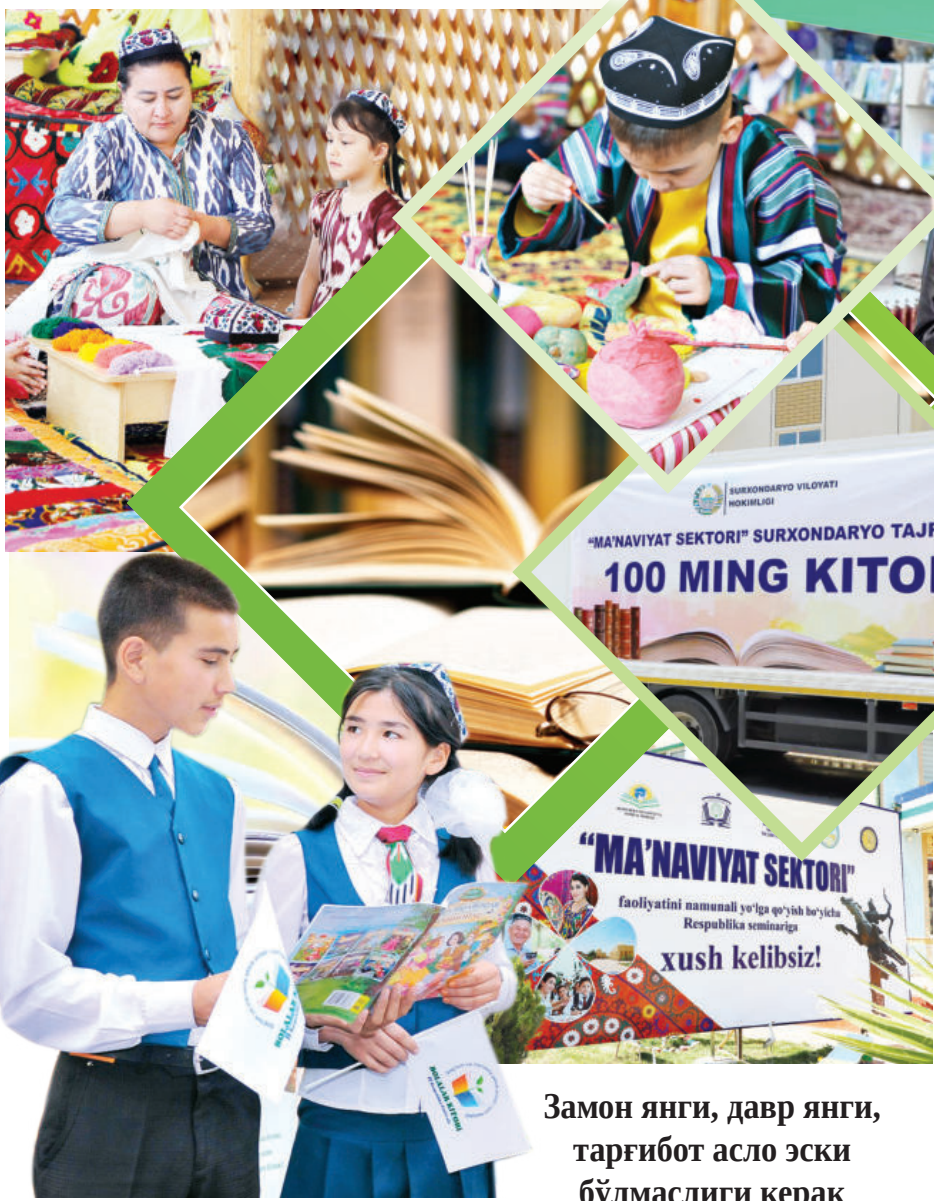
Замон янги, давр янги, тарғибот асло эски бўлмаслиги керак

Жумладан, Сурхондарё вилоятидаги бошқарма бошлиқлари, олий таълим муассасалари ректорлари 15 та туман (шаҳар) маънавият секторига масъул этиб белгиланган. Шу мақсадда 454 та мактабгача таълим ташкилоти, 960 та мактаб, 54 та профессионал таълим ва 7 та олий таълим муассасаси, 724 та маҳалла,