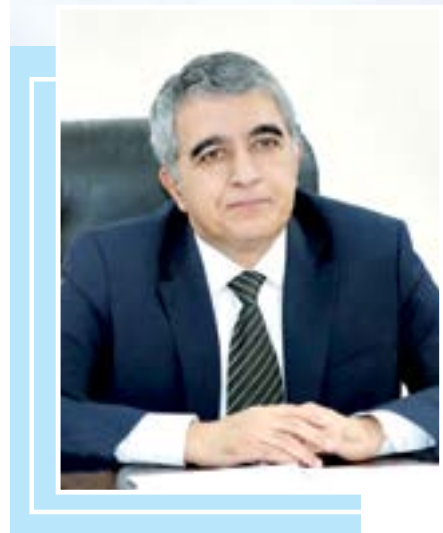
Шавкат ҲАМРОЕВ, сув хўжалиги вазири