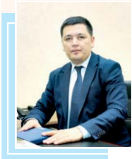
Расул РАҲМОНОВ, иқтисодий фанлари номзоди, профессор

Ўзбекистон — ижтимоий давлат. Конституциямизда мустақамланган ушбу ташкил асосида ижтимоий ҳимояга муҳтож қатлам вакиллари билан тизимли ишлар ташкил этиш бугун ҳар бир ташкилот, идоранинг вазифасидир. Меҳр ва кўмак тизимини аҳолига яқинлаштириш, ижтимоий хизмат ва ёрдам кўрсатиш механизмини соддалаштириш бугуннинг муҳим мавзусига айланмоқда.