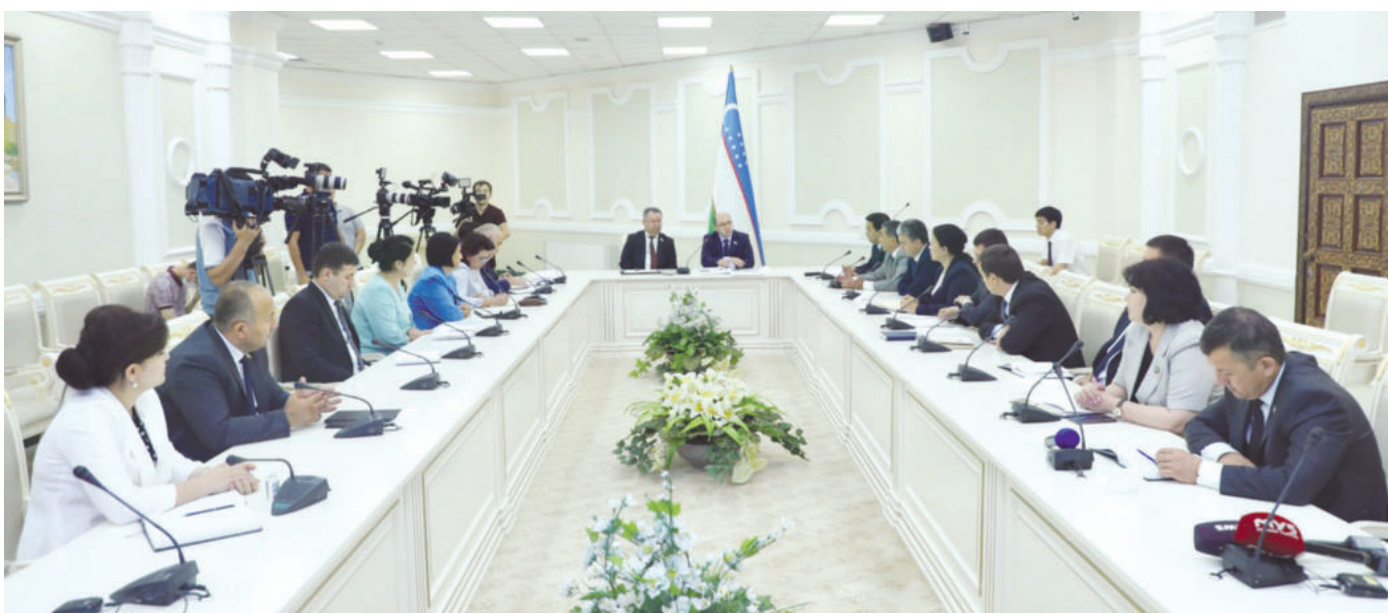
Жорий йил 14 июль кун Олий Мажлис Қонунчилик палатасининг Коррупцияга қарши курашиш ва суд-ҳуқуқ масалалари ҳамда Демократик институтлар, нодавлат ташкилотлар, фуқароларнинг ўзини ўзи бошқариш органлари қўмиталарининг қўшма мажлиси бўлиб ўтди.

Унда умумхалқ муҳокамасига қўйилган “Ўзбекистон Республикасининг Конституциясига ўзгартиш ва қўшимчалар киритиш тўғрисидаги Конституциявий қонун лойиҳаси юзасидан келиб тушаётган тақлиф ва мулоҳазаларни лойиҳада акс эттириш масаласи муҳокама қилинди.