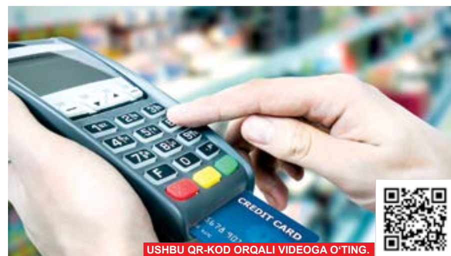
USHBU QR-KOD ORQALI VIDEOGA O'TING.

Yana bir masala, hozir raqamli banklar rivojlanib, mobil ilovalar orqali kredit olish imkoniyatlari yaratilgan. Rasmiylashtirish jarayonlarida odatda qarz oluvchi fuqarodan tashqari bir necha yaqinining mobil raqami ham so'raladi. Mijoz ularni kiritgach, o'sha