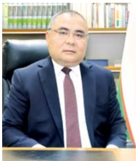
Иброҳим АБДУРАҲМОҲОВ, қишлоқ хўжалиги вазир, академик