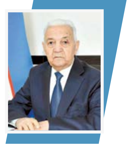
Убайдулла МИНГ'БОВЕВ, Ўзбекистон судьялари ассоциацияси раиси, Ўзбекистонда хизмат кўрсатган юрист

Мамлакатимизда аёллар ва болалар ҳуқуқларини таъминлаш, уларни ҳар қандай таъзия ва зўравонликдан ҳимоя қилиш ҳамда жамиятда бундай иллатларга нисбатан муросасизлик муҳитини шакллантириш мақсадида жорий йил 3 март куни Президентимизнинг “Аёллар ва болалар ҳуқуқларининг ҳимоясини кучайтириш ҳамда уларга нисбатан таъзия ва зўравонлик ҳолатларининг олдини олиш бўйича қўшимча ташкилий-ҳуқуқий чоралар тўғрисида”ги фармони қабул қилинди.