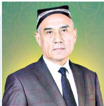
Шухрат СИРОЖИДДИНОВ, академик

2016 йили Самарқандда нашр этилган “Ўрта аср Шарқ аломалари ва мутафаккирларнинг тарихий-фалсафий мероси энциклопедияси”да Ўзбекистон ҳудудида туғилган 600 дан зиёд дин олимга доир қисқа маълумотлар берилган. Шунингдек, фалсафа, адабиёт, санъат соҳасида номи ва асарлари аниқланган бўлса-да, шахси бўйича чуқур тадқиқот ўтказилмаган юзлаб олим ва ижодкорлар яшаб ўтгани аниқланди.