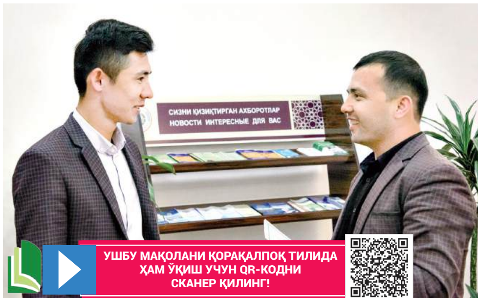
УШБУ МАҚОЛАНИ ҚОРАҚАЛПОҚ ТИЛИДА ХАМ ўқиш учун QR-КОДНИ СКАНЕР ҚИЛИНГ!

Мамлакатимиз етакчисининг халқ билан мулоқот сиёсатини давлат даражасига олиб чиқиши шунчаки мавсумий таъбир эмас, бунинг муҳим ижтимоий-иқтисодий ва сиёсий сабаби бор эди. Эсингизда бўлса, бундан 10 йил муқаддам, 2016 йил сентябрда интернет тармоғида Бош вазирнинг электрон қабулхонаси ташкил этилган эди. Ушбу қабулхонага қисқа даврда аҳолидан 218 мингдан ортиқ мурожаат