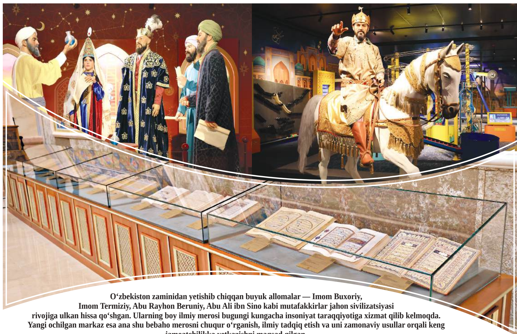
O'zbekiston zaminidan yetishib chiqqan buyuk allomalar — Imom Buxoriy, Imom Termiziy, Abu Rayhon Beruniy, Abu Ali ibn Sino kabi mutafakkirlar jahon sivilizatsiyasi rivojiga ulkan hissa qo'shgan. Ularning boy ilmiy merosi bugungi kungacha insoniyat taraqqiyotiga xizmat qilib kelmoqda. Yangi ochilgan markaz esa ana shu bebaho merosni chuqur o'rganish, ilmiy tadqiq etish va uni zamonaviy usullar orqali keng jamoatchilikka yetkazishni maqsad qilgan.

Ushbu markaz dunyo hamjamiyatiga boy merosimizni namoyon etadigan, uni keng targ'ib qiladigan va millatlararo hamkorlikni mustahkamlaydigan ishonchli ko'priq bo'lib qoladi.