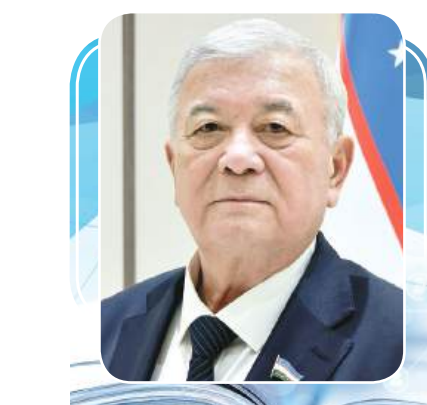
Qutbiddin BURHONOV, Oliy Majlis Senatining Mudofaa va xavfsizlik masalalari qo'mitasi raisi

Bugun jahonda turli qarama-qarshiliklar, tahlikali vaziyatlar kuchayib borayotgan bir sharoitda tinchlik, bag'rikenglik va ma'rifat g'oyalarni ilgari surish har qachongidan ham dolzarb ahamiyat kasb etmoqda.