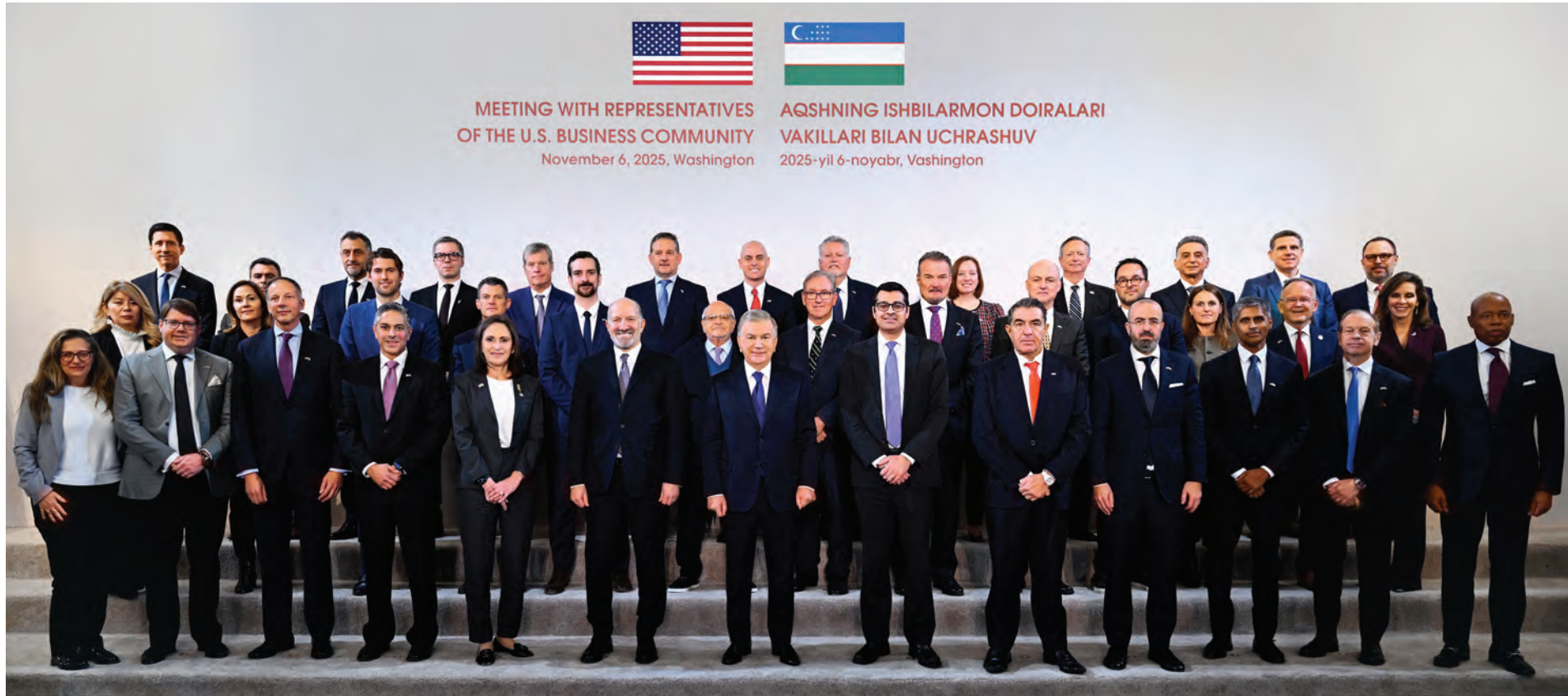
MEETING WITH REPRESENTATIVES OF THE U.S. BUSINESS COMMUNITY November 6, 2025, Washington AQSHNING ISHBILARMON DOIRALARI VAKILLARI BILAN UCHRASHUV 2025-yil 6-noyabr, Washington

Президент Республики Узбекистан Шавкат Мирзиёев по приглашению Президента Соединенных Штатов Америки Дональда Трампа 4-6 ноября пребывал с рабочим визитом в городе Вашингтоне.