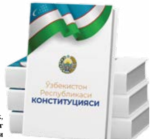
ваколатлари кучайган, масъулияти бир неча қарра ортган янги вакиллик тизими шаклланиши албатта барчамизни мамнун этади”.

байрам табриғида қайд этилганидек, “Меҳнатқаш, олижаноб ва бағрикенг халқимизнинг Янги Ўзбекистонини барпо этиш йўлидаги хоҳиш-иродаси, бирлиги ва ҳамжиҳатлиги, сиёсий маданияти яққол намоён бўлган ушбу сайловлар натижаларига кўра, юртимизда конституциявий ҳуқуқ ва