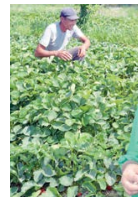
Нафақат маблағ, балки сув сарфи 25 фоизга тежайди. Ушбу тажриба юртимизнинг бошқа ҳудудларида ҳам қўлланади.

ҳисоби шаффоф юритилади. Экинларнинг сувга талабидан келиб чиқиб, истеъмолчилар ўртасида тенг тақсимланади, фермер деҳқон хўжалиқлари ва бошқа истеъмолчилар томонидан фойдаланилган сув ресурслари учун шаффоф солиқ базаси шакллантирилади. Туманда сув ресурсларини бошқариш тўлиқ хусусий секторга ўтказилиб, давлат бюджетидан ҳар йили сўғориш тармоқлари эксплуатациясига кетадиган маблағ иқтисод қилинади.