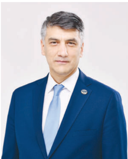
Алишер ҚОДИРОВ, Олий Мажлис Қонунчилик палатаси Спикери ўринбосари, "Миллий тикланиш" демократик партияси раиси

Шуни қатъий англаб олишимиз керак: бугун янги Ўзбекистон қандай тез, изчил ўзгариб бораётган бўлса, тилимиз ҳам шунга муносаб равишда ўзгариши, кучайиши керак. Бунга эса ҳамма — депутатдан тортиб, энг чекка қишлоқда фаолият юритаётган устоз ва педагогларимизгача бирдек масъулдир.