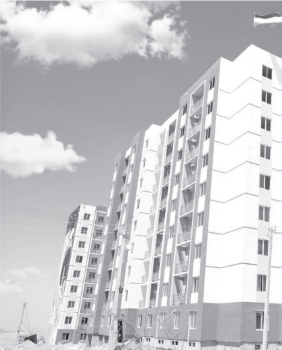
«Окончание. Начало на 1-й стр.»

Драйверными сферами в области становятся производство строительных материалов, текстильной, электротехнической, кожевенно-обувной, продовольственной и местной промышленной продукции. Наибольшее число проектов - 186 - будет реализовано в сферах текстильной, трикотажной промышленности, производства строительных материалов.