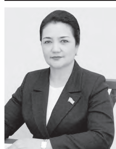
Мавдухон Ходжаева. Председатель Комитета по труду и социальным вопросам Законодательной палаты Олий Мажлиса Республики Узбекистан.