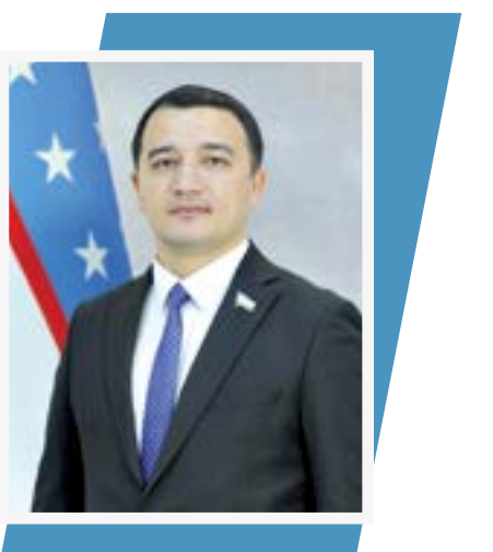
Otabel MUSURMONOV, Oliy Majlis Qonunchilik Palatasi deputati

"Yangi O'zbekiston yoshlari — 2030" strategiyasi yoshlarga oid davlat siyosatini yangi bosqichga olib chiquvchi muhim dastur hisoblanadi. Unda belgilab olingan vazifalar mamlakatimizning uzoq muddatli taraqqiyotiga, yigit-qizlar kelajigiga puxta zamin yaratadi.