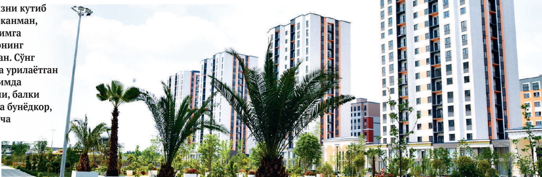
Шерзод ҚОРАБОВ ошган суратлар.

Учоқ зиналаридан тушиб, бизни кутиб турган мезбонлар сари юрарканман, то етиб боргунча дарров қўлимга телефонимни оламан-у, асарнинг шу жойларини топиб ўқийман. Сўнг бошимни кўтараман, юзимга урилаётган водий шамолдан тафаккуримда ўтмишнинг улғувор нафасини, балки мутлақо янги, шиддатли ва бунёдкор, юрак уришига ўхшаган айрича депсинишни ҳис қиламан.