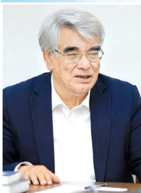
Usmon AZIM, O'zbekiston xalq shoiri