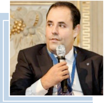
Ўзбекистон Президенти Шавкат Мирзиёевнинг Боку шаҳрида бўлиб ўтган Бутунжаҳон урбанизация форумининг 13-сессияси доирасидаги Етақчилар саммитидаги нутқи

— Ўзбекистон Президенти Шавкат Мирзиёевнинг Боку шаҳрида бўлиб ўтган Бутунжаҳон урбанизация форумининг 13-сессияси доирасидаги Етақчилар саммитидаги нутқи Ўзбекистон бугунги кунда Евроосиё маконидо барқарор ривожланиш, ижтимоий адолат ва замонвий урбанизация трансформациясининг фаол тарафдорларидан бирига айлангани яна бир бор намойён этди.