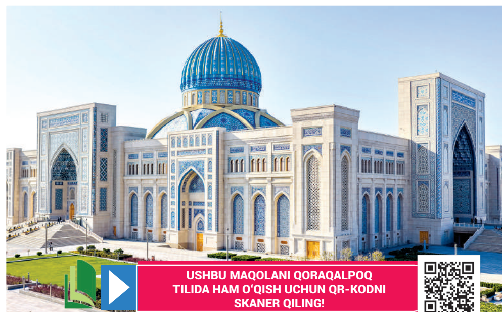
USHBU MAQOLANI QORAQALPOQ TILIDA HAM O'QISH UCHUN QR-KODNI SKANER QILING!

trillion dollarga yaqinlashishi mumkin. Algoritmik o'rganish texnologiyalari, katta ma'lumotlar tahlili, vizual ma'lumotlarni tahlil qilish tizimlari va intellektual boshqaruv mexanizmlari davlat boshqaruvidan tortib, tibbiyot, ta'lim, moliya va qishloq xo'jaligigacha bo'lgan sohalarini tubdan o'zgartirmoqda.