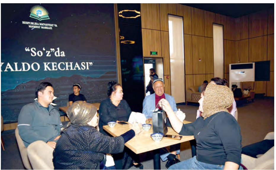
“So’z”da YALDO KECHASI

Шундан сўнг лойиҳа мантикий изчилликда давом этди: иккинчи концерт буюк мутафаккир боболаримиз Алишер Навоий ва Заҳриддин Муҳаммад Бобур таваллуд