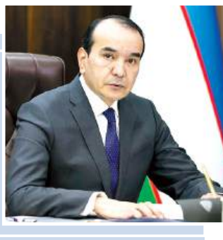
Ozodbek NAZARBEKOV, O'zbekiston madaniyat vaziri:

— Bugun o'zbek futbolida adolat qaror topdi desak, menimcha, eng to'g'ri gap bo'ladi. Chunki davlatimiz rahbarining o'zi bu masalaga shaxsan kirishdi. Mana, alohida e'tiborning katta natijasini ko'rib turibmiz. Demak, adolat bor joyda yoshlarimiz hech kimdan kam emasligini bemalol namoyon eta oladi. O'g'il-qizlarimiz sport, kitobxonlik sharofigidan uyli va mashinali bo'lyapti.