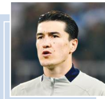
Eldor SHOMURODOV, futbol bo'yicha O'zbekiston milliy terma jamoasi sardori:

Turmush o'rtog'im bilan shunday harakatlarda oilaviy qatnashishimiz, farzandlarimizga namuna bo'lishimiz muhim degan xulosaga keldik. Zero, bugun real ishlaydigan mexanizm bor.