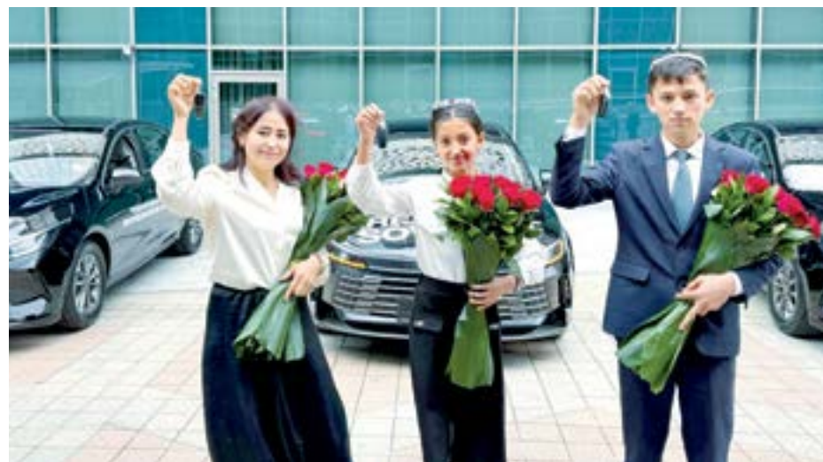
Shuning uchun ham "Yosh kitobxon" respublika tanlovining final bosqichiga aynan Bekobodda start berildi!

Deputat Yoqutxon Mo'minovaning ta'kidlashicha, "Har maktabga 100 kitob" tashabbusi doirasida yil davomida tumandagi 60 ta umumta'lim va 3 ta xususiy maktabga jami 20 mingga yaqin adabiyot sovg'a qilingan. Ushbu adabiyotlar har bir maktabga 500 dan ziyod akademik, olim, shoir, yozuvchi va jurnalistlarning dastxati bilan topshirildi. Shuningdek, 51 mahallada kutubxonalar sa'yiyada yaratilgan.