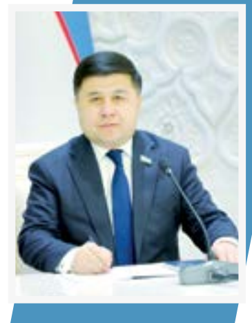
Botirali SHODIYEV, Oliy Majlis Qonunchilik palatasi deputati

Binobarin, o'tgan qisqa muddatda Prezidentimiz tashabbusi bilan Samarqandda keng ko'lami islohotlar, ulkan bunyodkorlik ishlari bajarildi. Shaharda zamonaviy infratuzilma shakllandi, ravon yo'llar, yangi massivlar,