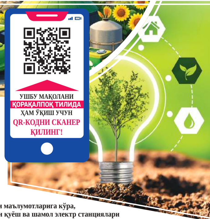
УШБУ МАҚОЛАНИ ҚОРАҚАЛПОҚ ТИЛИДА ҲАМ ЎҚИШ УЧУН QR-КОДНИ СКАНЕР ҚИЛИНГ!

тақчиллиги, ҳаво ифлосланиши ва чўлланиш жараёнлари мамлакатнинг экологик хавфсизлигига жиддий таъсир кўрсатмоқда.