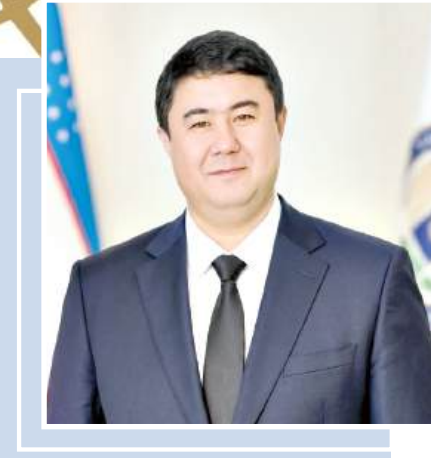
Музаффар ЭРКИНОВ, кинорежиссёр

Ёзнинг дастлабки кунли давлатимиз раҳбарининг санъат ва маданият аҳли билан учрашувида иштирок этиш имкониятига эга бўлдим. Очиғини айтсам, бу шунчаки навбатдаги йиғилиш ёки расмий тадбир эмас, балки мамлакат етакчисининг ижодкорга, унинг дардига, ташвишига, орзу ва мақсадларига бўлган кўнунчақ муносабатини яна бир бор акс эттирган самимий мулоқот эди.